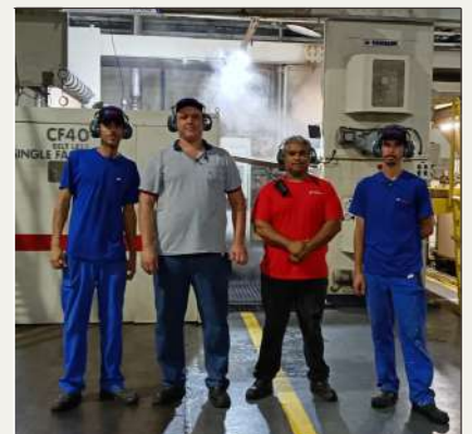
Junior e parte da equipe 2026