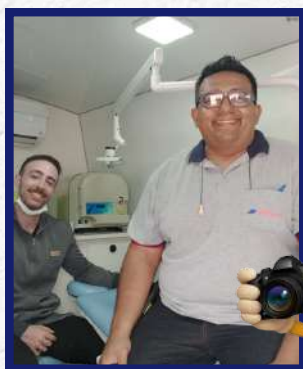
Unidade de Santa Rosa - Consulta odontológica