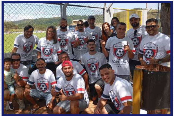
Nossa torcida uniformizada fez a diferença e levantou o astral do jogo