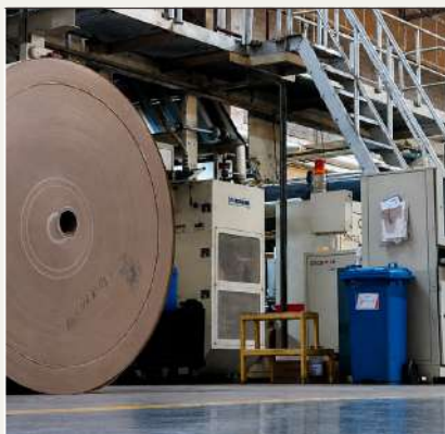
Onduladeira Santa Rosa