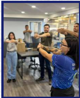
Unidade de Itatiba - Ginástica Laboral