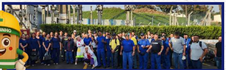
Unidade de Santa Rosa - Humoristas fazendo teatro sobre segurança no trabalho