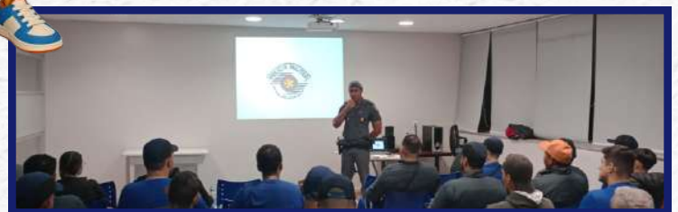
Unidade de Santa Rosa - Palestra com Sargento da Polícia Militar sobre segurança no trânsito