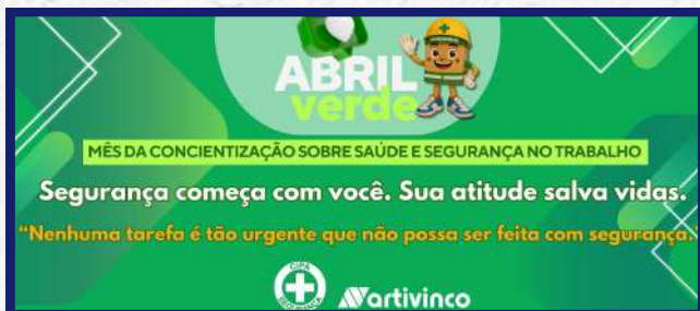
Faixa do evento que ficou exposta em ambas as unidades durante o mês de Abril

Ao longo de todo o mês, promovemos uma série de ações nas unidades de Santa Rosa de Viterbo e Itatiba, com o objetivo de engajar os colaboradores em práticas mais seguras e saudáveis no ambiente de trabalho. Essa campanha teve como objetivo reforçar o compromisso com a saúde e a segurança, um movimento dedicado à conscientização e à prevenção de acidentes de trabalho. Foi um convite à reflexão e à mudança de atitudes. Cuidar de si mesmo e do colega ao lado é fundamental para construirmos um ambiente de trabalho cada vez mais seguro, saudável e produtivo.