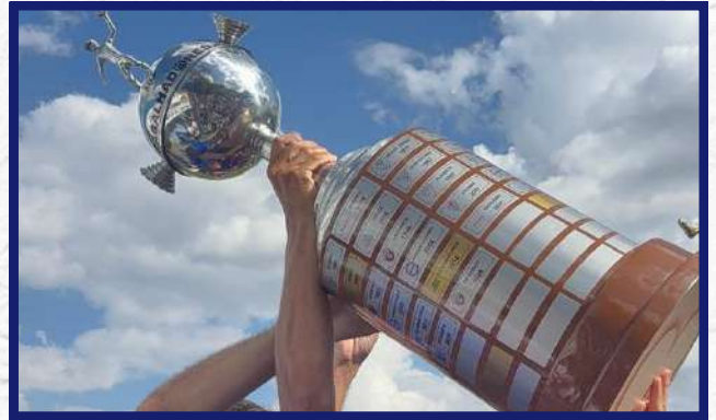
A taça de campeão do torneio dos trabalhadores 2026

Parabéns ao time por essa conquista especial!