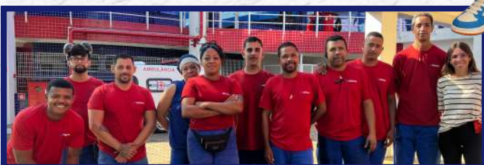
Unidade de Itatiba - Parte da equipe da brigada de incêndio, que conduziu nosso simulado de abandono.