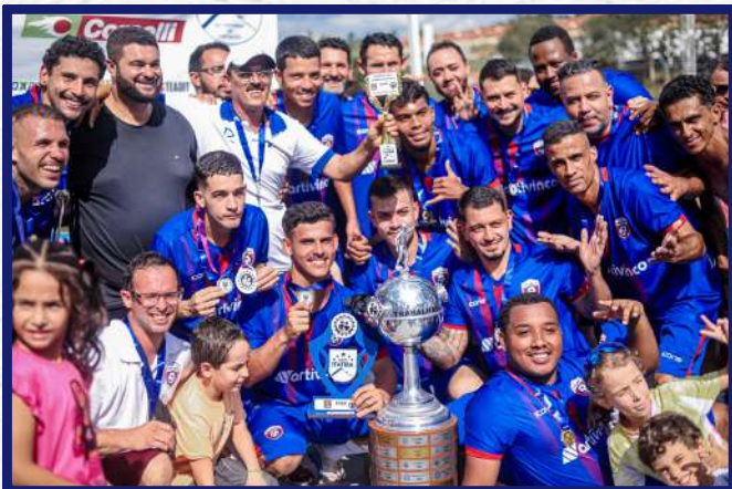
O time Artivinco recebendo o merecido troféu de campeões

Com mais essa conquista, a Artivinco chega ao seu sexto título, consolidando uma trajetória vitoriosa no torneio e garantindo o status de hexacampeã, com títulos conquistados nos anos de 1995, 1996, 1999, 2010, 2025 e 2026.