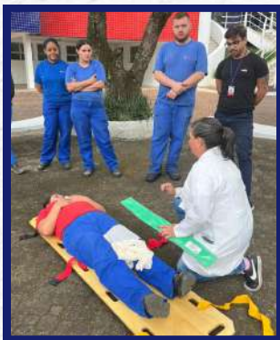
Unidade de Itatiba - Simulação de primeiros socorros

As atividades incluem: simulado de emergência e evacuação em caso de incêndio, diálogos de segurança, orientações práticas no dia a dia, ações educativas e momentos de conscientização, sempre reforçando que a segurança é uma responsabilidade de todos.