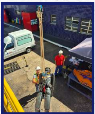
Unidade de Santa Rosa - Trabalho em altura